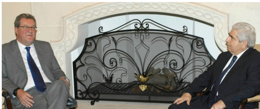
Ban Ki-Moons särskilde rådgivare Alexander Downer och president Christofias.

Antalet militära överträdelser i FN:s buffertzonen minskade under perioden november 2010-maj 2011 jämfört med halvåret före.