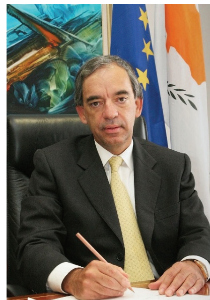
Finansminister Charilaos Stavrakis

"Regeringen är fullt medveten om utmaningarna och fortsätter att på allvar arbeta för att stödja utvecklingen och den gemensamma välfärden", sa han den 13 maj när han fått ta del av de senaste ekonomiska prognoserna för Cypern.