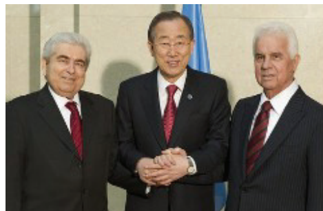
Christofias, Ban Ki-Moon och Eroglu i Genève i januari.

Det kommer att bli fler förberedande möten, både för ledarna och även för deras representanter. Parterna anstränger sig för att närma sig varandra, enligt Alexander Downer. Närmandet syns i frågor som har att göra med styrelsekick och maktfördelning, men inte i frågor som rör egendom och territorium.